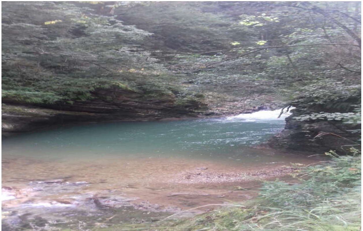
Поездка в с. Никитино.